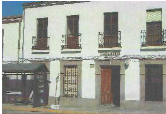
Imagen inventario precedente noviembre 2005