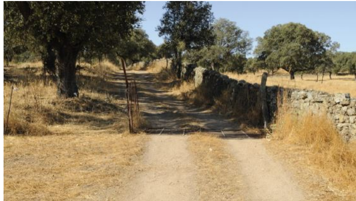
Camino de Córdoba