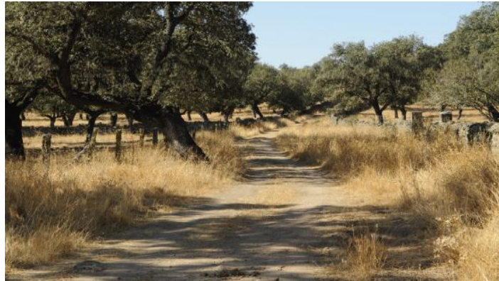
Camino de Córdoba