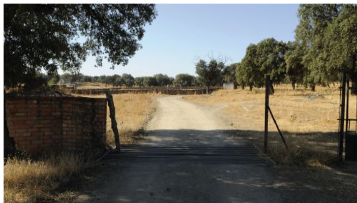
Camino de Córdoba