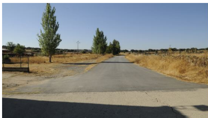
Camino de Córdoba