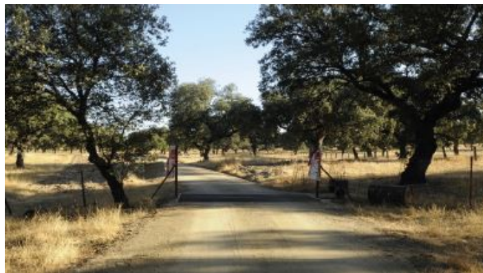
Camino de las Herrerías o Carril de Herrerías