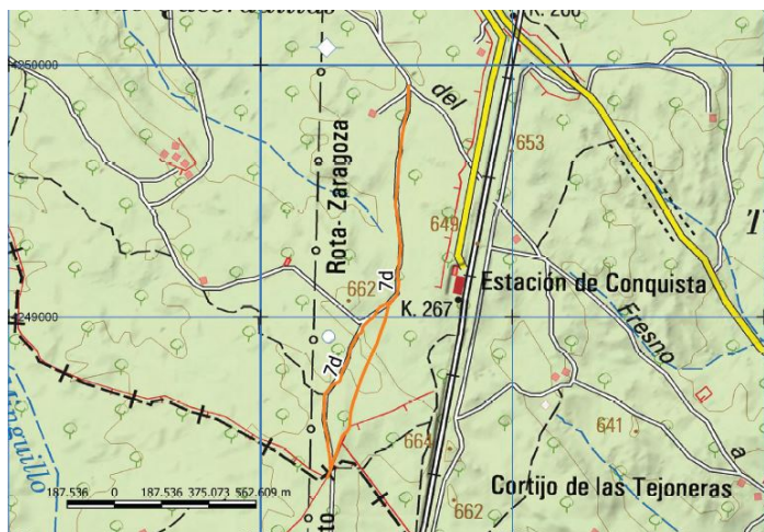
Camino de las Herrerías o Carril de Herrerías