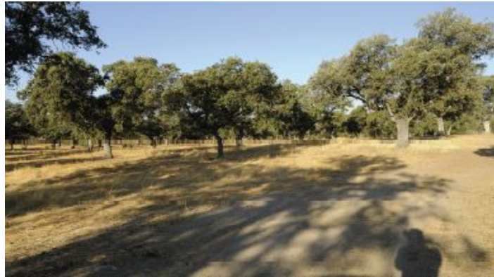
Camino de las Herrerías o Carril de Herrerías