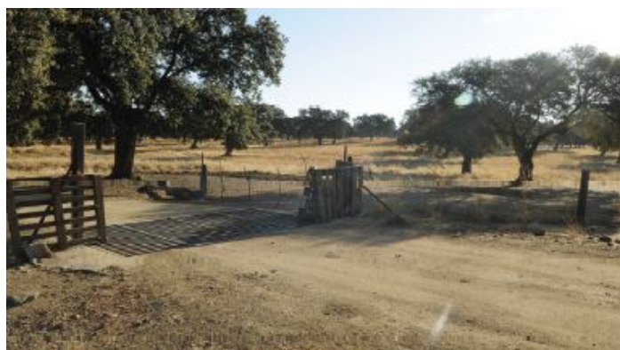
Camino de las Herrerías o Carril de Herrerías