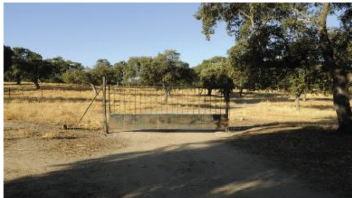
Camino de las Herrerías o Carril de Herrerías