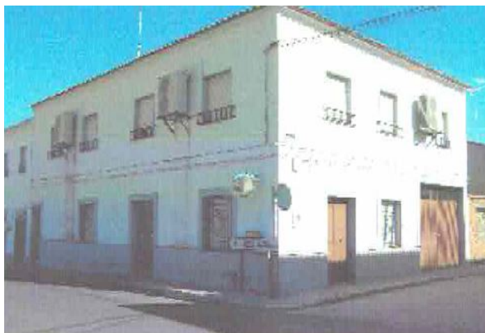
Imagen inventario precedente noviembre 2005